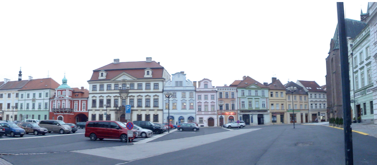
Hradec Královén Velké náměstí

en skismassa eri kilpailijoiden välillä oli, paitsi maksanut Václaville keisarin arvon, myös etäännyttänyt hänen kotimaisesta kirkon virallisesta hierarkiasta. Pettymys tästä sai hänet tukemaan Prahan Kaarlen yliopiston hussilaisia reformisteja. Kun Václav sittemmin alkoi myötäillä katolisia, se oli seurausta kahden mahtimiehen paavi Martinus V:n ja kuningas Sigismundin ankarasta painostuksesta. Aivan ilmeisesti Sigismundin painostus vaikutti myös Prahan Nové Měston uuden raadin (neuvoston) uskontopoliittisesti yksipuoliseen koostumukseen. Kuningas Václav oli ajettu nurkkaan. Myös hänen kuninkuutensa Böömissä alkoi olla uhattuna ainakin ulkopuolelta, ellei hän taipuisi. Velipuoli Sigismund vain odotti tilaisuuttaan paavi Martinus V selustatukenaan.